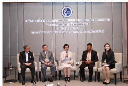
สรุปทั้งหมด กรุงเทพฯ--29 มี.ค.--สมาคมเทคโนโลยีชีวภาพสัมพันธ์

ข่าวทั่วไป ThaiPR.net -- พุธที่ 29 มีนาคม 2561 13:48:52 น.