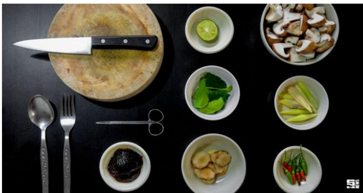
ธุรกิจกลุ่มโฮเรกาไทยโต1 ล้านล. รัฐ-เอกชนเล็งจัดงานใหญ่ต่อยอด

ซี แทรนด์บูริโกดนิมรับประทานอาหารนอกบ้าน ผนวกจำนวนนักท่องเที่ยวที่เพิ่มสูงขึ้น ส่งผลธุรกิจโฮเรกาเมืองไทยมีมูลค่ากว่า 1 ล้านล้านบาท เดือดพุ่งตลอด 3 ปี ล่าสุดเอเชีย โฮเรกา ผนึก ที่เส็บ และสมาคมการบริการโรงแรมจัดงานใหญ่ HORECA ASIA 2017 หรือผลักดันธุรกิจเติบโตแบบยั่งยืน