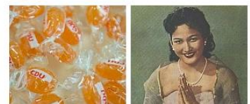
เสาวรส ผลไม้ชั้นยอด สรรพคุณเทียบตั้งแต่ รากยันผล

Market-Comms Co.,Ltd 12/123 VisionVille 5 Soi Samakki 34 Samakki Road T. Tha-Sai A. Muang Nonthaburi 11000 Thailand Tel. 662 575 2415-7 Fax. 662 575 2418 Email. info@market-comms.co.th www.market-comms.co.th