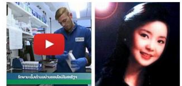
พาชมโครงการ รักษา มะเร็งทรวงอก "ผ่านคค" ผ่านคค "เตียง ลี จวิน" นีลัน" ในสหรัฐฯ