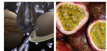
พบ 'ฝนตกเป็นเพชร' บนดาวเสาร์กับดาวพฤหัสบดี