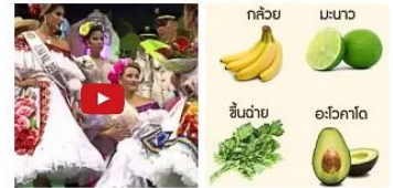
นางงามอันดับ 2 กระชากมงกุฎจากผู้ชนะเลิศ พร้อมโพสท่าจนท้อใจ