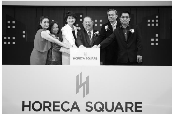
ข่าวใหม่ | ข่าวสารและกิจกรรม