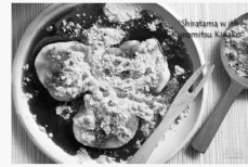
Feature | vdo คลิปสอนทำ ขนมญี่ปุ่นโบราณ Shiratama with Kuromitsu Kinako