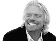
Richard Brandson Founder, Virgin Group

Publicity is absolutely critical. A good PR story is infinitely more effective than a front page ad.